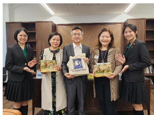
▲ 圖八 學姊與校長互贈禮