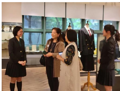
▲ 圖四 使節導覽校史室