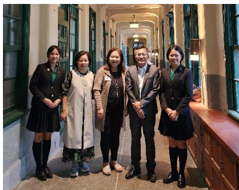
▲ 圖一 於光復樓合影