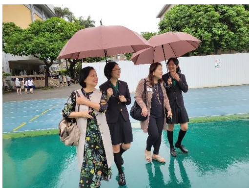
▲ 圖三 前往校史室的路上