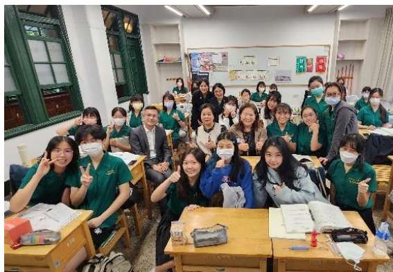
▲ 圖二 與高一學生短暫交流後合影