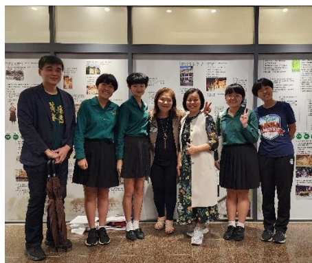
▲ 圖七 與樂儀隊同學合照