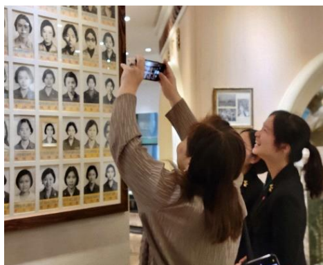
▲ 圖五 在榜首牆上發現同窗好友